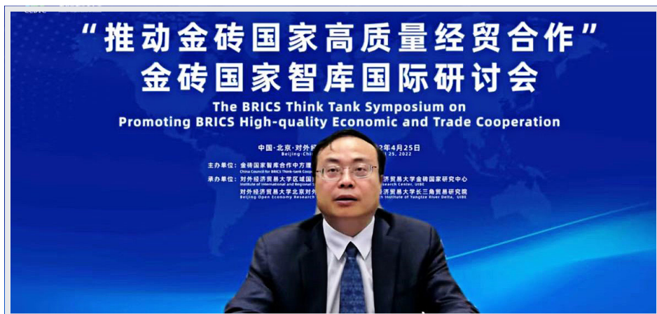
سمپوزیوم اتاق فکر بریکس در سال ۲۰۲۲

● تحلیل روابط بین آفریقای جنوبی و کشورهای بریکس (ازمنظر منافع ملی آفریقای جنوبی، منافع قاره آفریقا و منافع کشورهای عضو بریکس). لازم به توضیح است که اولین سمپوزیوم اتاق فکر بریکس-۲۰۲۲ در آوریل ۲۰۲۲ به صورت برخط و به میزبانی شورای چین برای همکاری اتاق‌های فکر بریکس برگزار شد. سومین سمپوزیوم بین‌المللی اتاق فکر بریکس نیز در سپتامبر ۲۰۲۲ به صورت برخط برگزار شد. گفتنی است مرکز مطالعات بریکس ذیل موسسه توسعه فودان ۱ وابسته به دانشگاه فودان مسئولیت برگزاری سومین سمپوزیوم بین‌المللی اتاق فکر بریکس را برعهده داشت ۲ [۱۵].